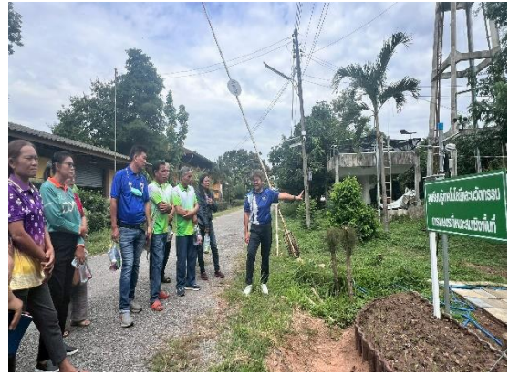
๒) ศึกษาดูงาน ณ สวนป่านาภู ตำบลบ้านเม็ง อำเภอนองเรือ จังหวัดขอนแก่น ด้านการทำวนเกษตรอย่างยั่งยืน